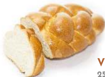
Vianočka 250g, 350g balená / nebalená krájaná / nekrájaná