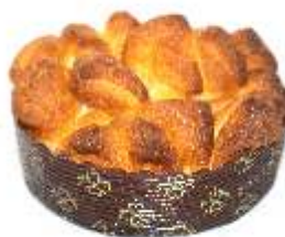
Trhanec škoricový 80g balený / nebalený