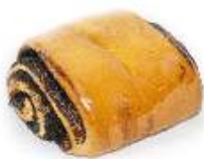
Závin mini kakao 120g, balený / nebalený plnka: kakaová