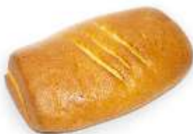
Šatôčka jablko 70g, balená / nebalená plnka: jablková+javor. sirup