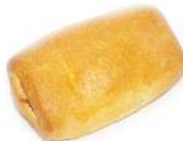
Šatôčka džemová 70g, balená / nebalená plnka: ovocná zmes