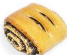
Závin mini mak 120g, balený / nebalený plnka: maková