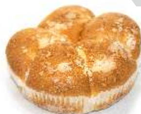
Buchty s javor. sirupom 300g, balené plnka: jablko-javor. sirup