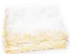
Francúzsky krémeš 100g, nebalený plnka: vanilková lístkové cesto