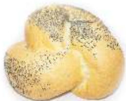
Pletenka veľká 100g