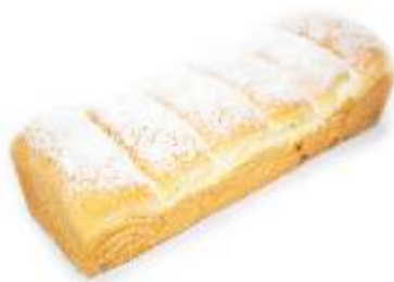
Babičkiné buchty 50g / 1kus, nebalené plnka: slivkový lekvár