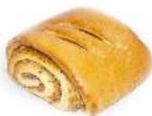
Závin mini orech 120g, balený / nebalený plnka: orechová