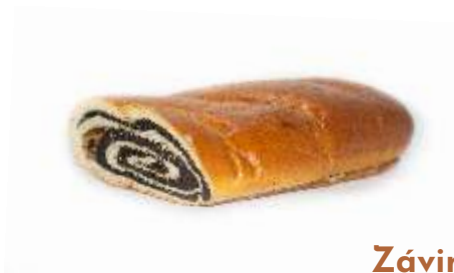
Závin mak 250g, balený plnka: maková