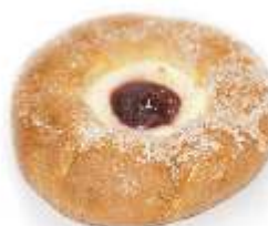
Vanilková ruža 70g, nebalená plnka tvaroh, višňa cukrový posyp