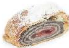
Štrúdl'a maková 90g, nebalená plnka: makovo-višňová