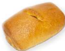
Šatôčka vanilka 70g, balená / nebalená plnka: vanilkový krém