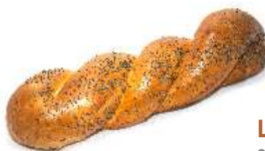
Lupačka veľká 80g, posyp: mak