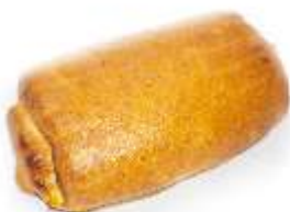
Šatôčka marhuľa 70g, balená / nebalená plnka: marhuľová