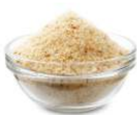
Strúhanka 400g balená