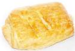
Pľundra vanilka+čučor. 80g, balená / nebalená plnka: čučoriedková +vanilkový krém