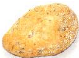
Viaczrnná dalamanka 90g, obsahuje zmes zaparených zrn. Vysoký obsah vlákniny, bez laktózy