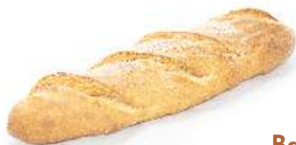
Bageta kvásková 200g