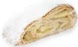
Štrúdl'a jablková 90g, nebalená plnka: jablko-orechová,