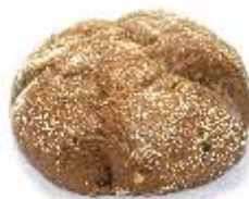
Toskánske pečivo 50g, obsahuje pufovanú špaldu, sezam, ľan, slnečnicové semienka