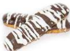
Eclair caramel 45g, nebalený plnka: karamel, čokoládovo-cukrová poleva