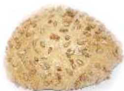
Slniečnicová kocka 70g, posyp: slnečnicové semienka