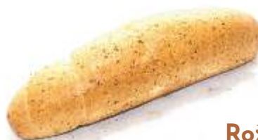
Rožok grahamový 45g, bez laktózy, nízky obsah tuku a cukru