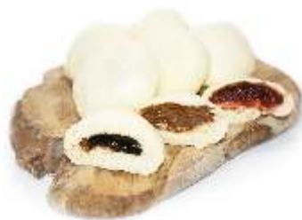
Buchty parené 400g, balené po 6ks plnky: džemová / lekvárová / čoko-oriešková