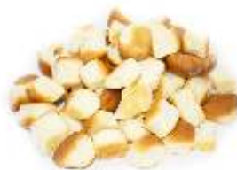
Dukátové buchty 300g