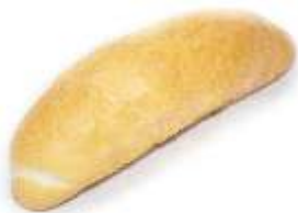
Rožok obyčajný 45g / 70g