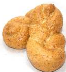
Grahamová pletenka 50g