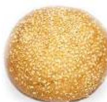
Hamburgerová žemľa 100g, balená 4ks, nebalená posyp: sezam