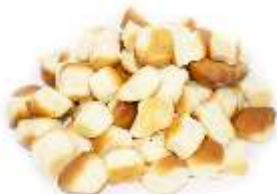
Opekance 280g, balené vodové suché 350g, balené tukové