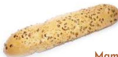
Mamma mia bageta 160g, obsahuje zmes slniečnicových a ľanových semienok. Vysoký obsah vlákniny, vitamínu D, vápnika, železa, kyseliny listovej