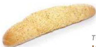
TOP PRODUKT ★ Ľanový rožok 70g, obsahuje zmes ľanových semienok, ovsených vločiek, pšeničných klíčkov a sezamu