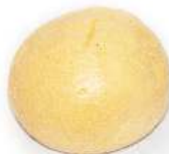
Žemľa malá / veľká 50g / 100g / 150g