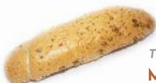
TOP PRODUKT ★ Mamma mia rožok 65g, obsahuje zmes slniečnicových a ľanových semienok. Vysoký obsah vlákniny, vitamínu D, vápnika, železa, kyseliny listovej