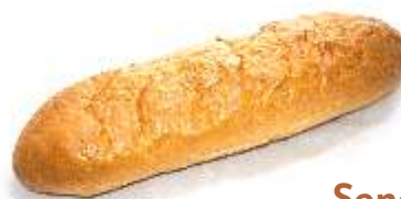
Sendvič 400g krájaný / nekrájaný balený