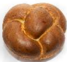
Veľkonočná paska 150g, 250g balená