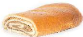
Závin orech 250g, balený plnka: orechová