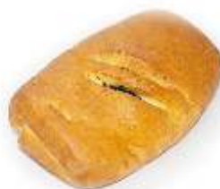
Šatôčka kakao 70g, balená / nebalená plnka: kakaová