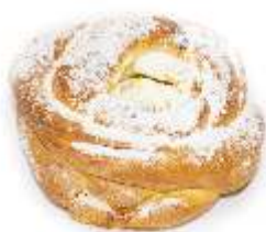
Kvet plnený 50g, nebalený plnka: tvaroh, cukrový posyp