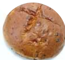
Vianočný chlebík 250g, obsahuje čokoládové lupienky, drvené orechy a hrozienka, balený