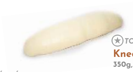
★ TOP PRODUKT Knedľa parená 350g, 700g