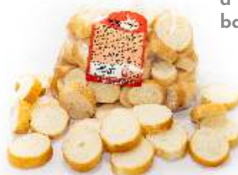
Silvestrovské rožky 230g balené, krájané