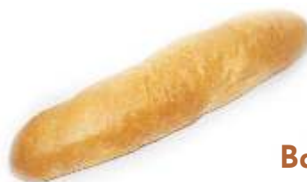
Bageta obyčajná 110g / 120g / 150g