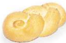
Pletenka malá 50g